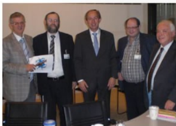
Foto Zikna met Mr.C.G. van der Staaij

Maar dit antwoord typeert Zikna. En op carnaval, én op poerim verkleed men zich. Op beide dagen wordt ook gedronken. Maar Poerim geeft ons een actuele inhoud mee. Poerim is Jewish revival door en met simche (blijdschap), door inhoud, door betekenis en door perspectief.