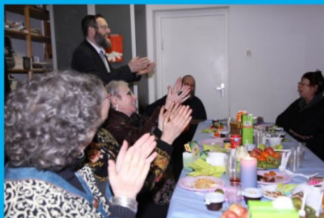
Een vrolijke Toe Bisjwat met Zikna