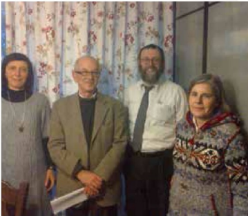
De training van onze vrijwilligers op 10 februari

Gedurende de afgelopen maanden heeft Zikna meer structuur gekregen. Zikna heeft haar plaats gekregen binnen joods Nederland. Dat is ook bevestigd in recente afspraken met de joodse gemeente Amsterdam. Ondertussen gaan wij verder, met een nieuwe uitvoering van Music en spirit waarvan op blz. 3 enkele fotos, met een hele fijne bijeenkomst t.g.v toe bijwat en een nieuwe training voor onze vrijwilligers (zie foto). Ook